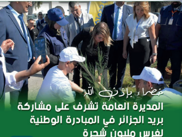
خضراء باذن الله المديرة العامة تشرف على مشاركة بريد الجزائر في المبادرة الوطنية لغرس مليون شجرة