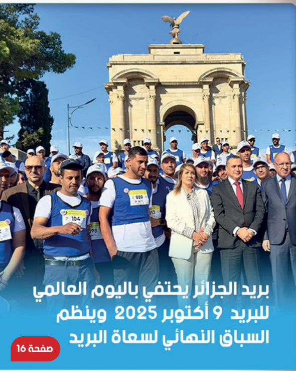
بريد الجزائر يحتفي باليوم العالمي للبريد 9 أكتوبر 2025 وينظم السباق النهائي لسعاة البريد