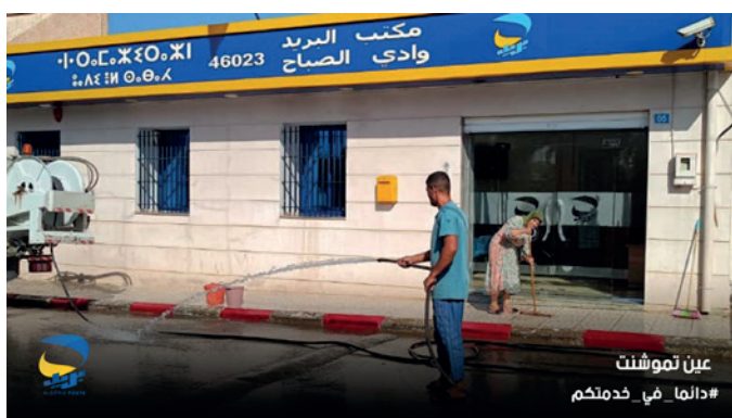
عين تموشنت #دالما_في_خدمتكم

هذه الأعمال، التي جرت بتناسق ميداني بين الإطارات والعمال، تظهر مدى التزام المؤسسة بمعايير النظافة والتنظيم، وتعكس حرصا على تقديم صورة موحدة وراقية لبريد الجزائر كمؤسسة عصرية ومواطنة.