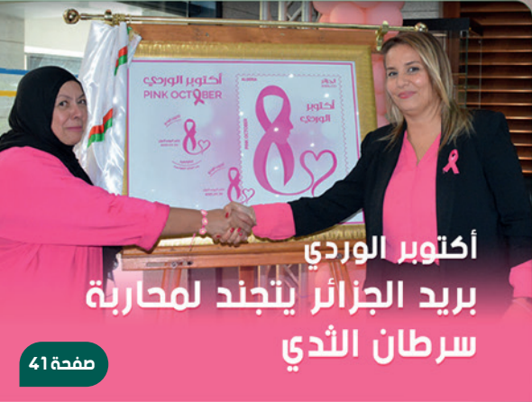
أكتوبر الوردي بريد الجزائر يتجند لمحاربة سرطان الثدي