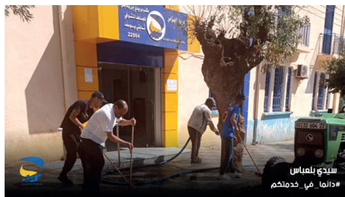
سيدي بلعباس #دالما_في_خدمتكم